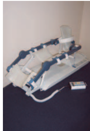
Knie-Hüft-schiene "Artromot K2/K2 Pro"

und sorgt so für eine schnellere Heilung. Aus diesem Grund sind diese Motorschie-